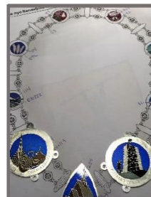
Produksjonsprosessen på fabrikk