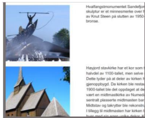
Kartlegging av viktige steder/ monumenter/merker/symboler Valg av Hovedmotiver/sekundermotiver