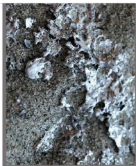
Valg av materialer