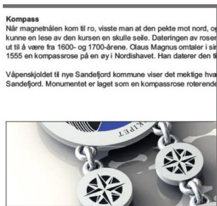
Detaljert beskrivelse av hvert enkelt element i kjedet